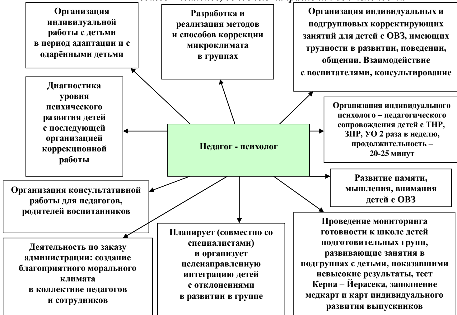
Рис. 2 «Педагог - психолог, основные направления деятельности»